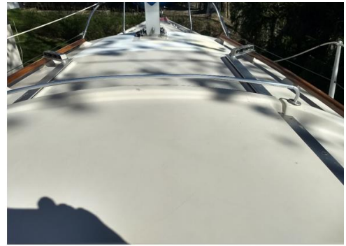
Bild3: Draufsicht auf meine Varianta mit den aktuellen Maßen

Vielleicht ist auch mein Haltebügel nicht ganz korrekt.