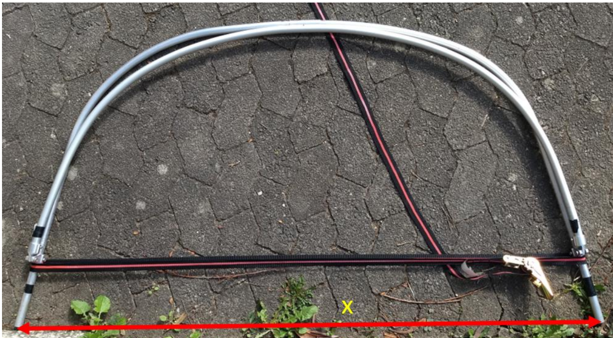
Bild1: Sprayhoodgestänge als Bilddatei. Das Maß x=1450\text{mm} . Das Maß ist wichtig für den Vergrößerungsfaktor.