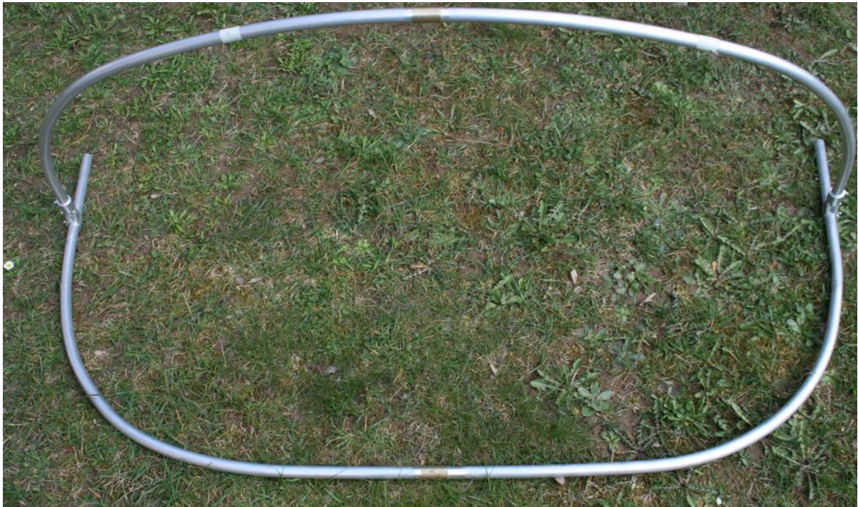
Lagerung der Sprayhood ermittelt